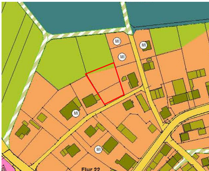
Abbildung 1: Auszug aus dem Flächennutzungsplan der Verbandsgemeinde Ulmen

Der wirksame Flächennutzungsplan der Verbandsgemeinde Ulmen stellt den Hauptteil des im Geltungsbereich gelegenen Teil der Parzelle Gemarkung Lutzerath, Flur 22, Flurstück Nr. 5/1 als Mischbaufläche dar. Lediglich eine Dreiecksfläche von ca. 110 m 2 werden als Fläche für die Landwirtschaft dargestellt.