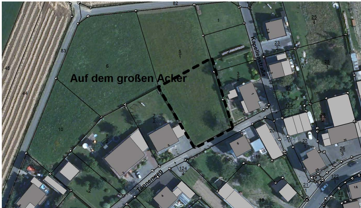
Abbildung 2: Lage des Satzungsbereichs

Die Siedlungspotenzialfläche liegt unmittelbar am „Tannenweg“. Die zur Überplanung anstehende Teilfläche weist eine Größe von ca. 1.069 m 2 auf.