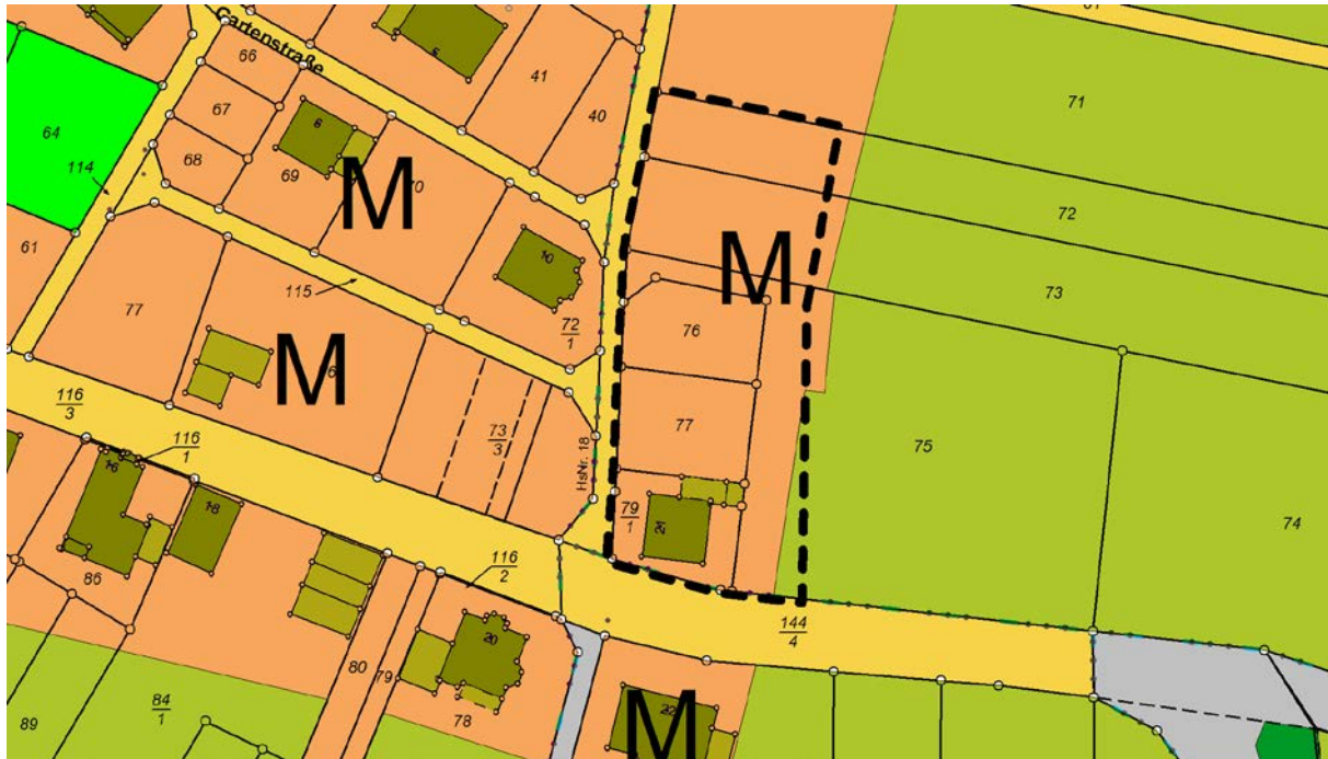
Abbildung 1: Auszug aus dem Flächennutzungsplan der Verbandsgemeinde Ulmen

Der wirksame Flächennutzungsplan der Verbandsgemeinde Ulmen stellt den Hauptteil der im Geltungsbereich gelegenen Parzellen Gemarkung Lutzerath als Mischbaufläche dar. Lediglich ein kleiner Streifen im Südosten ist als landwirtschaftliche Flächen dargestellt.