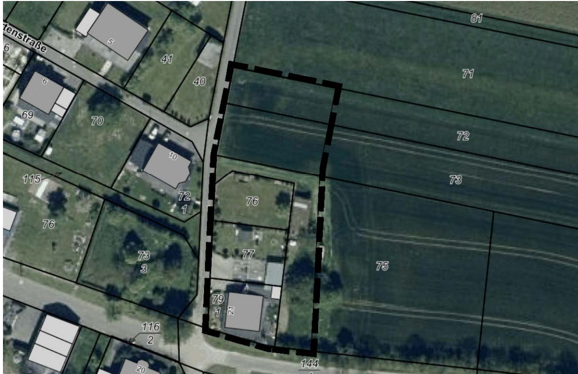
Abbildung 2: Lage des Satzungsbereichs

Die Umgebungsbebauung stellt sich als typisches Baugebiet dar. Das Satzungsgebiet selbst unterliegt zur Zeit der ackerbaulichen und der gartenbaulichen Nutzung.