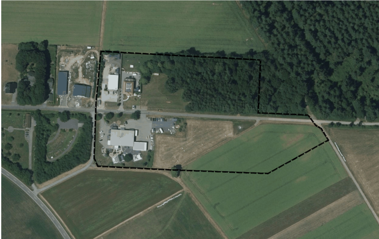
Abbildung 1: Luftbild, Caigos WeSt-Stadtplaner GmbH