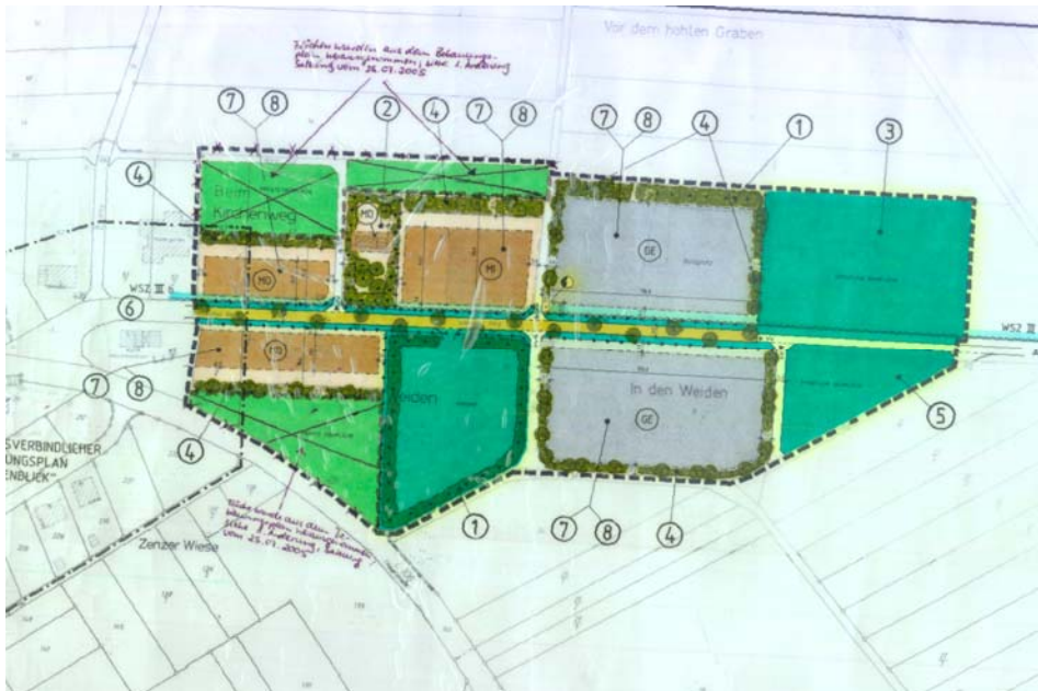
Abbildung 2: Stammbebauungsplan