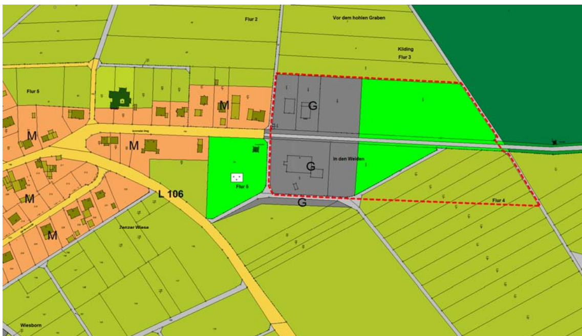
Abbildung 3: Ausschnitt aus dem Flächennutzungsplan der VG Ulmen