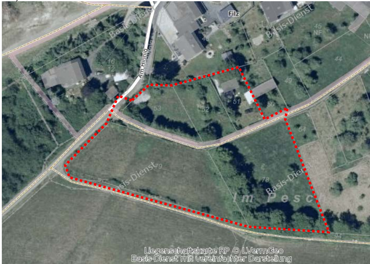
Abbildung 3: Luftbild

Der zu beplanende Bereich wird derzeit als landwirtschaftliche Fläche genutzt. (siehe Luftbild).