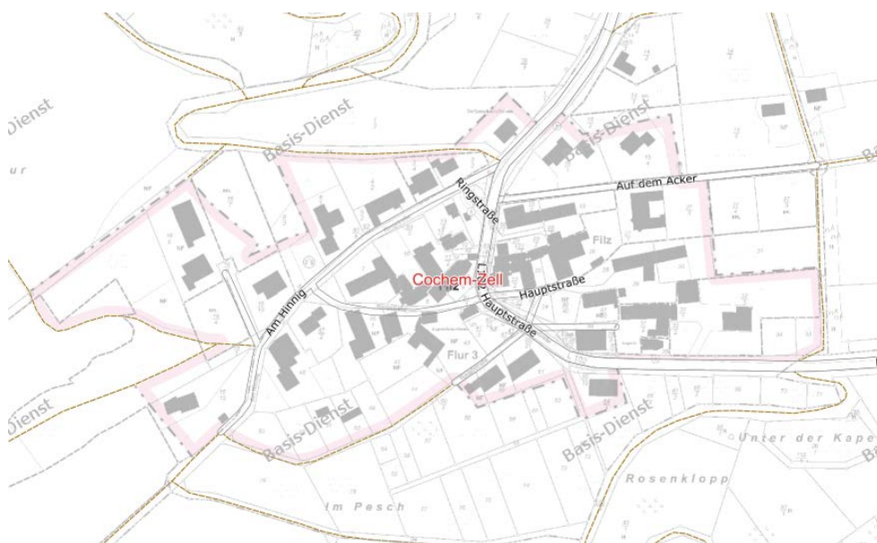
Abbildung 1: Übersicht

Das Plangebiet liegt im Süden von Filz und überplant landwirtschaftliche Flächen.