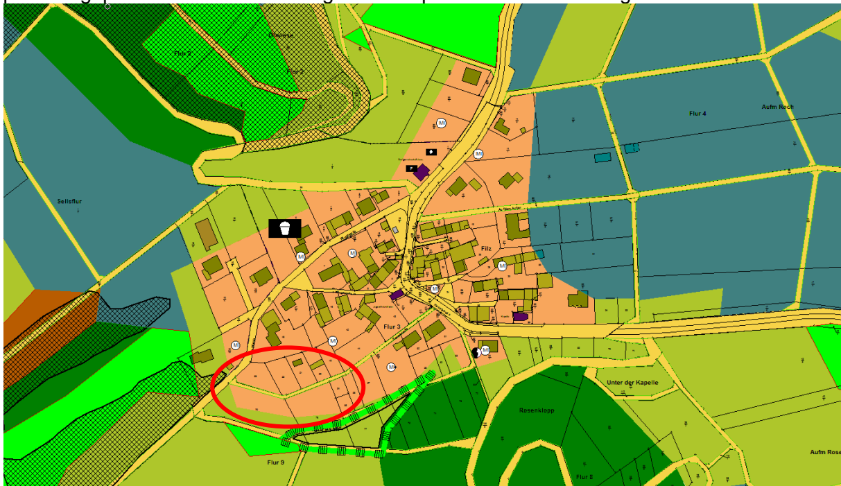
Abbildung 2: Ausschnitt aus dem Flächennutzungsplan

Der Flächennutzungsplan stellt für den Geltungsbereich Mischbauflächen dar. Der Flächennutzungsplan wird in der laufenden Fortschreibung an die Festsetzungen des Bebauungsplans angepasst und das neue Baugebiet entsprechend berücksichtigen.