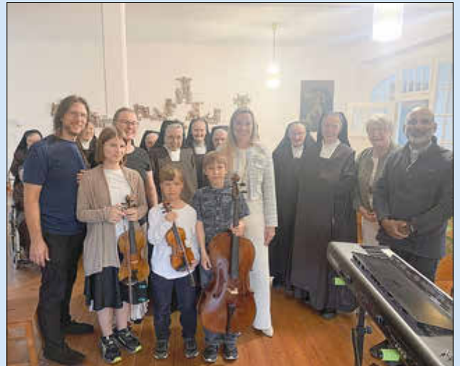
Am Sonntag, 21.06.2026 18:00 Uhr, wird der Gottesdienst im Kloster Waldfrieden von der Singgruppe ANIMO gestaltet.