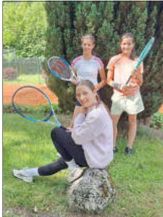
Schauen zufrieden auf Ihre erste Spielsaison zurück: U15 Mädchen des TCBB

Am Samstag, den 13.6. beendeten unsere U15 Mädchen ihre allererste Medenrundensaison mit 0:3 gegen die erfahrenen Mädchen des TC GW Bausendorf1 auf unserer Anlage in Bad Bertrich.