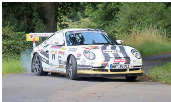
Am 25. juli sorgen die Helfer des SFK Ulmen wieder für die Sicherheit an der Strecke