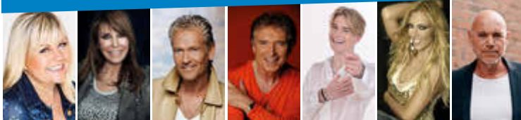
Gaby Baginsky, Ireen Sheer, Olaf Berger, Peter Orloff, Vincent Gross, Loona und Olaf Henning