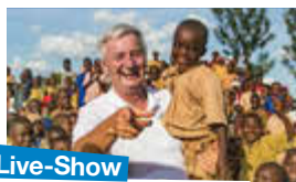
Live-Show mit Reiner Meutsch