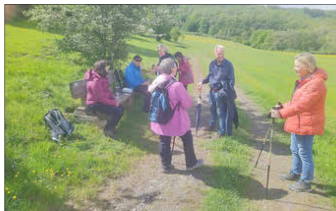
... und genossen bei zwar kühlem, aber sonnigen und trockenen Wetter die herrliche Vulkaneifel rund um Strotzbüsch.