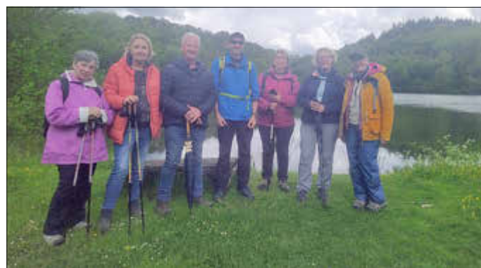
Zu einer schönen Wanderung am Vatertag kamen einige Wanderfreunde des Eifelvereins Ulmen zusammen...

Die restlichen Teilnehmer wanderten noch etwas weiter und genossen von der Üssbachhütte den Blick ins Siebenbachtal. Über einen steilen Abstieg wurde die Talsohle und die Strotzbüsch Mineralquelle erreicht, wo es sich die Wanderer nicht nehmen ließen, das warme Heilwasser zu kosten. Die gut besuchte Mühle nebst Campingplatz im Tal ist ein Anziehungspunkt für große und kleine Gäste und auch unsere Wandergruppe legte dort eine kleine Rast ein, bevor ein schmaler und malerischer Pfad wieder bergan und zurück nach Strotzbüsch führte. Bei dem an diesem Tag ausgerichtetem dortigen Vatertagsfest der Möhnen fanden dann alle Eifelvereiner gemeinsam einen zünftigen Abschluss bei einem Bierchen, Currywurst und Livemusik der Gruppe „2 Be-Better“. „Das war insgesamt ein wirklich schöner Vatertag in der Natur, bei guten Gesprächen und einem tollen Abschluss“, waren sich alle Teilnehmer*innen einig und dankten der Wanderführerin für die Vorbereitung und Führung der Wanderung.