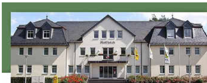
Marktplatz 1, 56766 Ulmen

Bereitschaftsdienst Handy-Nr.: ..... 0171 9744942