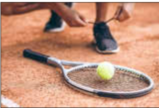
Tennisschuhe binden und los gehts in die Saison 2026