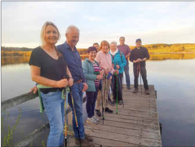
Der Jungferweiher bot den Teilnehmer*innen der Gesundheitswanderung eine tolle Umgebung...