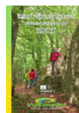
Titelblatt Naturerlebnis- broschüre 2026/2027

Mit dem Naturerlebnisprogramm 2026 präsentiert der Natur- und UNESCO Global Geopark Vulkaneifel gemeinsam mit seinen Partnern ein außergewöhnlich vielfältiges Portfolio buchbarer Natur- und Landschaftserlebnisse. Rund 650 Termine von etwa 35 zertifizierten Natur- und Geoparkführern machen die Vulkaneifel ganzjährig erlebbar und stärken ihre Position als naturnahe, nachhaltige Erlebnisregion.