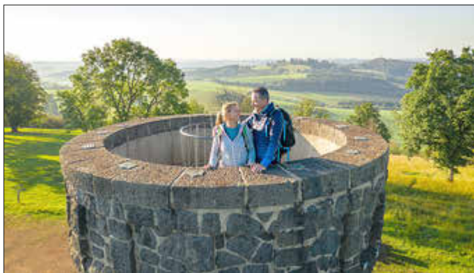
Den besten Ausblick hat man vom Dronketurm auf dem Mäuseberg

Die abwechslungsreiche Rundtour verbindet eindrucksvoll die typische Vulkanlandschaft mit weiten Ausblicken, stillen Maaren und naturnahen Pfaden. Ein echtes Aushängeschild für die Region und genau deshalb verdient sie die Unterstützung aller, die gerne draußen unterwegs sind und ihre Heimat schätzen.