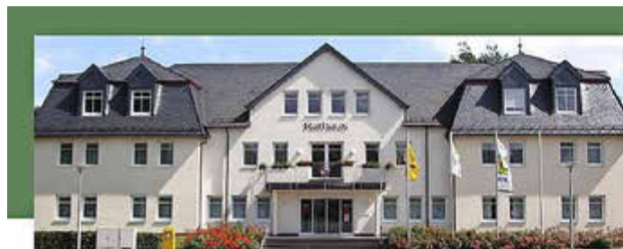
Marktplatz 1, 56766 Ulmen

Bereitschaftsdienst Handy-Nr.: ..... 0171 9744942