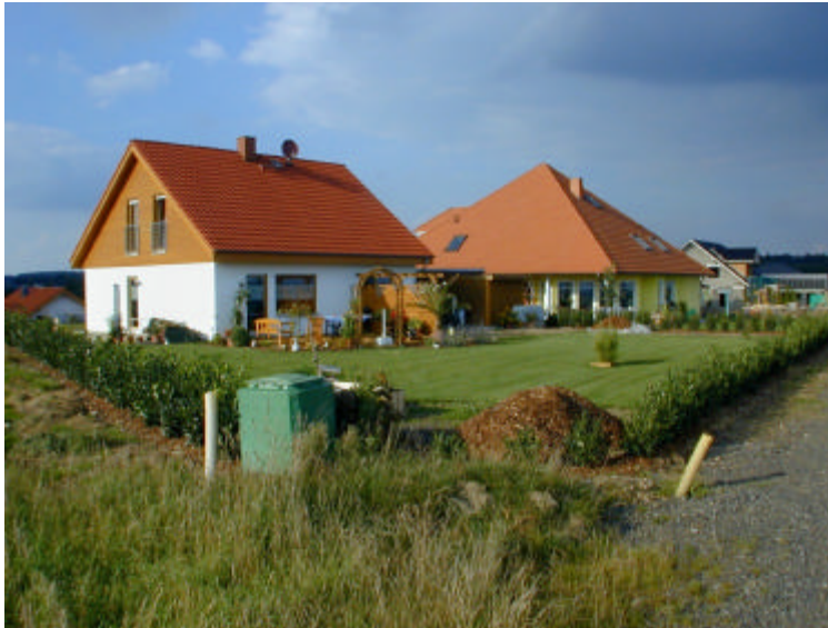
Auderath hat derzeit 585 Einwohner

Die Ortsgemeinde Auderath , anerkannte Fremdenverkehrsgemeinde im Herzen der Vulkaneifel, ist eine idyllische kleine Gemeinde mit hohem Wohn- und Erholungswert.